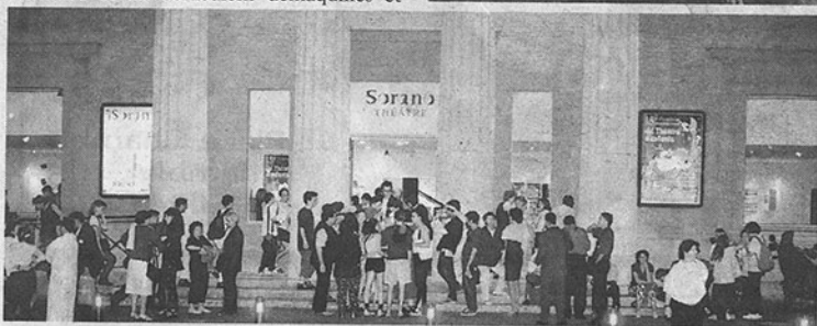
Le théâtre Sorano qui a accueilli le festival.

La troupe de théâtre de la Bourrasque quelques minutes avant d'entrer en scène.